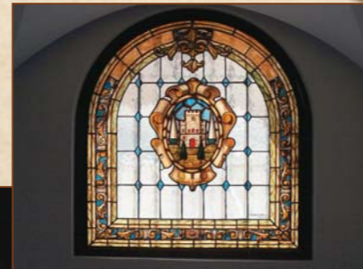
Vidriera a la entrada del Museo Arqueológico