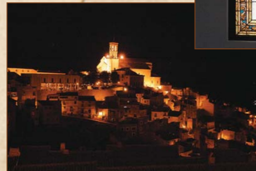
Vista nocturna del casco antiguo