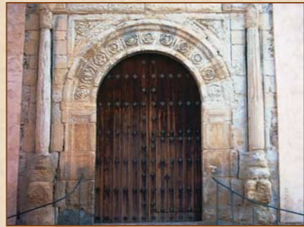
Portada Renacentista Iglesia de La Concepción S. XVI.

Merecen ser citadas aparte las iglesias de Santa María Magdalena, la de La Soledad y la Iglesia de La Concepción.