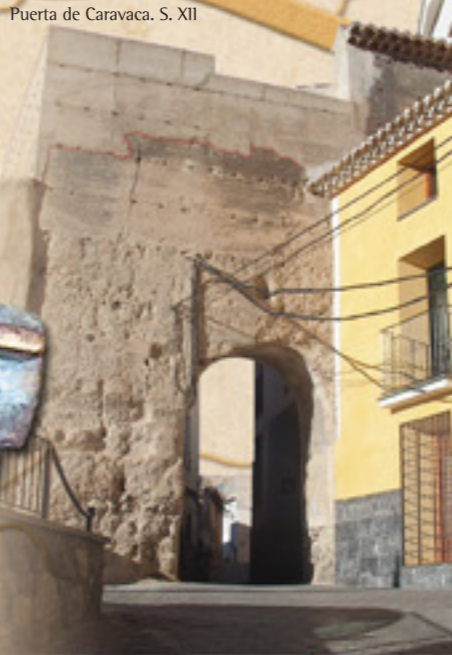
Puerta de Caravaca. S. XII