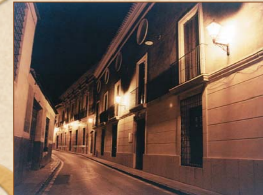
Casa del Conde de Campillos y Casa Jaspe (Actual Ayuntamiento)