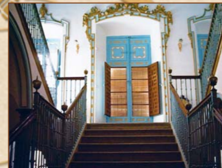
Escalinata Imperial estilo Rococó del Ayuntamiento