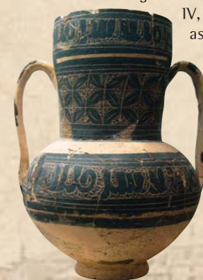
Jarrita esgrafiada musulmana S. XII

Aunque el actual asentamiento de la ciudad de Cehegín se produce en la Edad Media en base a una iniciativa islámica, hay que remontarse bastantes siglos atrás para profundizar en sus orígenes. Es un hecho probado que los abrigos y cuevas de Peña Rubia fueron aprovechados desde el Neolítico como lugares de enterramiento, perdurando como sagrada tradición durante varios siglos. Numerosos yacimientos arqueológicos dan testimonio del paso de las principales culturas prehistóricas y de la Antigüedad por estas tierras como lo son las culturas argárica e ibérica. En el siglo